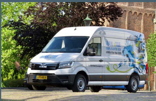
Totaal ontzorgd elektrisch rijden? Kies voor H2E Power van Roordink.

Met de H2E Power laadpas kunt u uw elektrische bedrijfswagen flexibel en voordelig laden bij elk publiek laadstation in